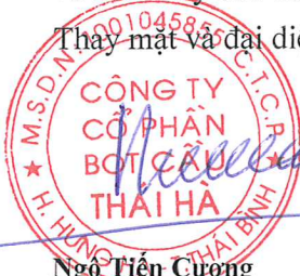
Ngô Tiến Cường Chủ tịch Hội đồng quản trị

Thay mặt và đại diện Hội đồng quản trị công ty./.