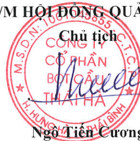
Ngô Tiên Cương